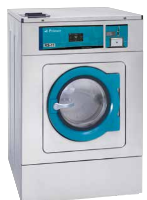
Fichero/monedero Coin-token box Monnayeur jetons