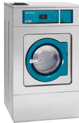
Central de pago Central payment Centrale de paiement

Les lave-linge essorage medium ont besoin d'être fixés au sol. Avec une pré-installation pour la centrale de paiement (une carte d'interface est nécessaire). Avec une pré-installation pour le fichier monnayeur (un Kit fichier monnayeur est nécessaire). Voir caractéristiques détaillées dans le catalogue des machines à laver.