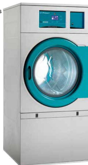
Central de pago Central payment Centrale de paiement

Sèche-linge avec une centrale de paiement et une pré-installation du fichier monnayeur (un kit fichier monnayeur est nécessaire). Sèche-linge avec pompe à chaleur : il n'a pas besoin de sortie de condensation. Ceci favorise l'économie d'énergie et c'est indispensable pour les petits espaces sans aération. Voir caractéristiques détaillées dans le catalogue des sèche-linge.