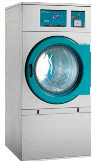
Fichero/monedero Coin-token box Monnayeur jetons