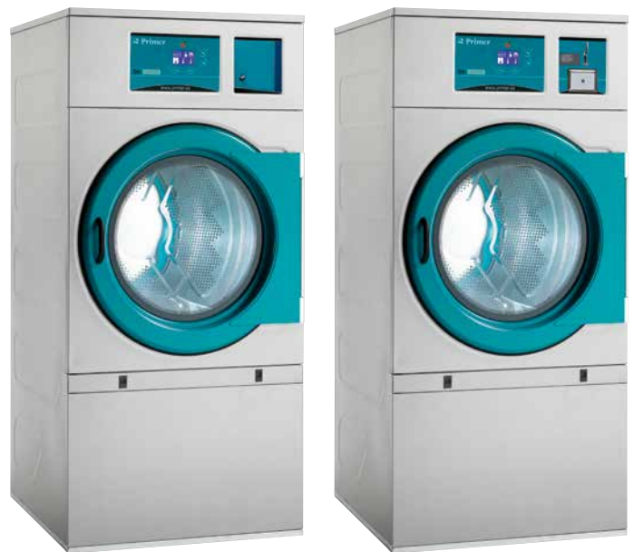
Central de pago Central payment Centrale de paiement

Sèche-linge digitaux avec une centrale de paiement et une préinstallation du fichier monnayeur (un kit fichier monnayeur est nécessaire). Voir caractéristiques détaillées dans le catalogue des sèche-linge.