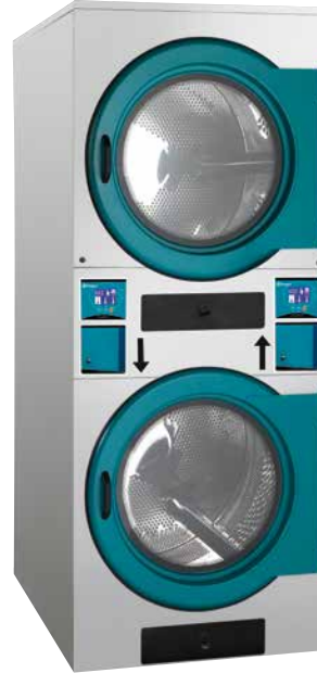
Central de pago Central payment Centrale de paiement

Sèche-linge avec une centrale de paiement et une préinstallation du fichier monnayeur (un kit fichier monnayeur est nécessaire). Sèche-linge compact à double tambour est idéal pour de petits espaces. Voir caractéristiques détaillées dans le catalogue des sèche-linge.