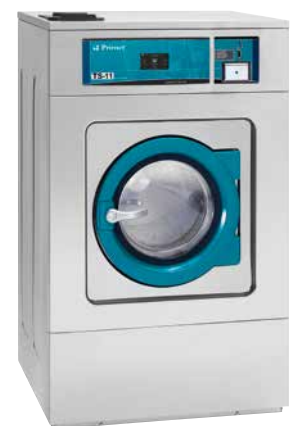
Fichero/monedero Coin-token box Monnayeur jetons