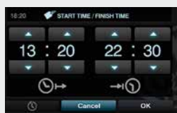
Tiempo Time Temps