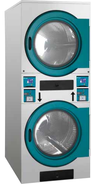
Fichero/monedero Coin-token box Monnayeur jetons